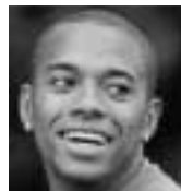
Robinho (28 años) Futbolista

Envíenos una foto con sus datos y el mensaje a Málaga hoy , Sección Agenda (calle Martínez, 11. Cuarta planta. C. P. 29005. Málaga) o bien a la dirección digital felicitacion@malagahoy.es . Adjuntar una fotocopia del DNI del remitente y un teléfono de contacto.