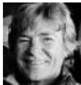
Ángel Nieto (65 años) Expiloto de motociclismo