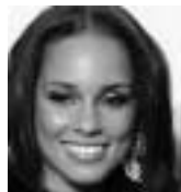
Alicia Keys (31 años) Cantante