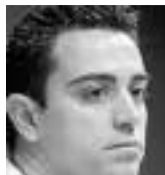
Xavi Hernández (32 años) Futbolista